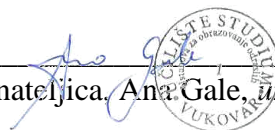
Ravnateljica, Ana Gale, univ.spec.pol.

UČILIŠTE STUDIUM- ustanova za obrazovanje odraslih